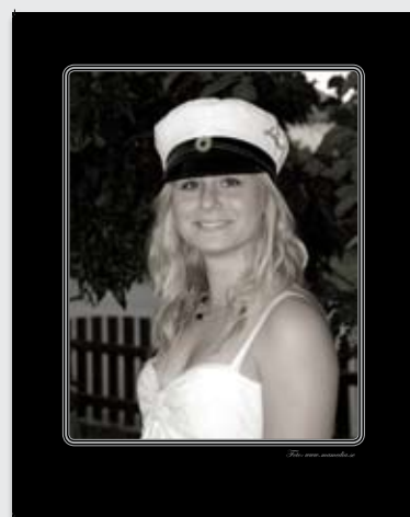
Studentfoto monterat i InDesign och utskrivet på canvas i 40 x 50 cm.