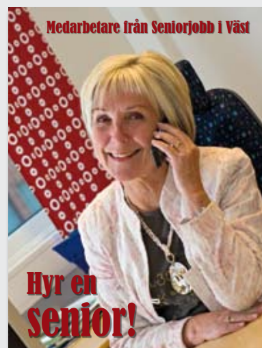
Fyrsidig folder tryckt i A5-format.

MaMedia har producerat text, bild och layout samt utformat merparten av annonserna t o m oktober 2008.